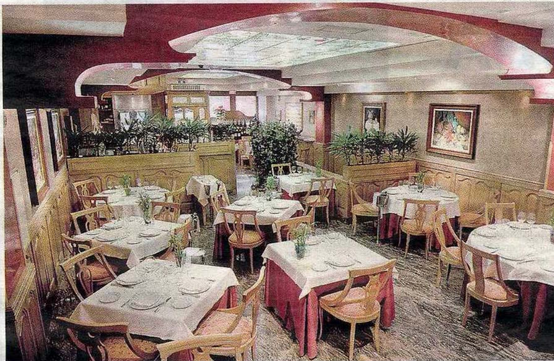
Uno de los dos comedores de Ferreiro, decorado en un estilo sin complicaciones. FERNANDO VILLAR

En Ferreiro no hay que buscar sofisticación en las elaboraciones, pero sí esos platos de cuchara clásicos que enlazan con la cocina tradicional asturiana. También es un restaurante recomendado para sentarse a la mesa esperando un buen pescado y marisco o aquellas carnes rojas de primera presentes en la carta y en los platos tan típicos